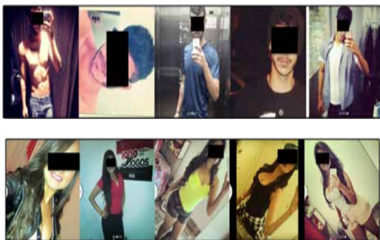
Figura 5 – alguns perfis que estão mais próximos do estereótipo de beleza ressaltam os aspectos do culto ao corpo.

A partir dos processos de mídiatização, novas lógicas vão sendo criadas ou melhor estabelecidas,