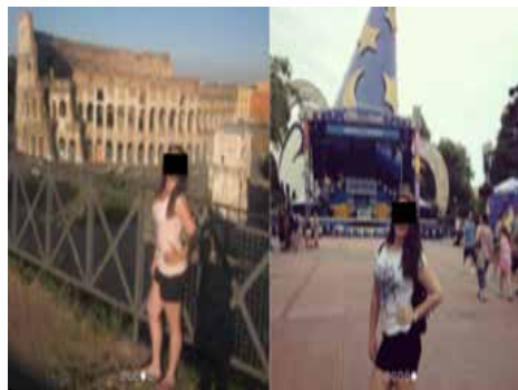
Figura 3 – fotos de viagem são comuns entre os usuários

A utilização de fotos que situam geograficamente o fotografado pode ser encarada como uma articulação de sentido tanto quanto se o usuário estivesse portando um produto mais tangível, como um carro importado, por exemplo. A própria dimensão da paisagem, portanto, se reconfigura a partir de uma lógica do consumo, como se pudesse ser tangibilizada – ser fotografado implica em ter experienciado, como é o caso da Figura 3 :