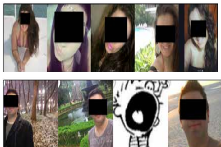
Figura 6 - perfis que aparentam desacordos com as estruturas que impõem as lógicas do corpo sarado recorrem a outras formas de exposição, ocultando imagens de corpo inteiro ou investindo nas descrições de about.