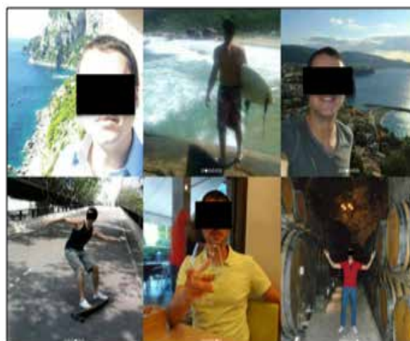
Figura 4- usuário constrói o seu personagem pautando um estilo de vida, ressaltando a prática de esportes como surf, skate, viagens e o consumo de vinhos